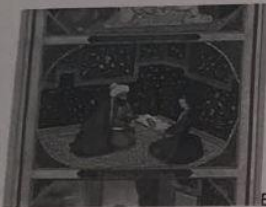
El sultán y Scheherezade

As mil e unha noites (en árabe, وليلة ليلة ألف Alf layla wa-layla ) é unha célebre recompilación medieval en lingua árabe de contos tradicionais del Oriente Medio, que utiliza en estes a técnica del relato enmarcado.