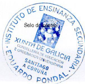
Óscar Couto Vifiegلاس