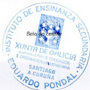
Óscar Couto Viñeglas