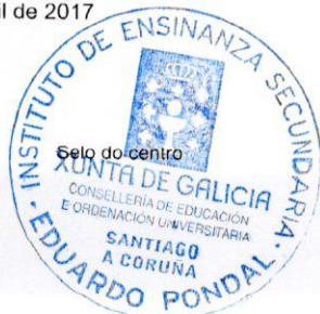
Óscar Couto Viñeglas