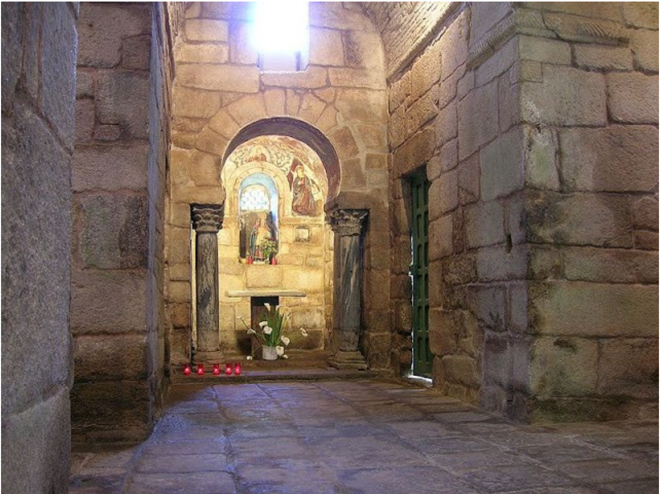
SANTA COMBA DE BANDE, Ábside

Bóvedas de cañón en herradura (descargan directamente sobre los muros) en los cuatro brazos de la cruz y bóveda de aristas en el crucero montada sobre arcos de herradura. Bóvedas en ladrillo de tipo espina de pez (técnica romana). Como los templos visigodos no suelen estar abovedados lo anterior singulariza a este edificio.