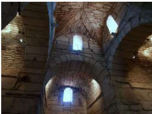
STA. COMBA DE BANDE, arcos de medio punto e iluminación interior

En el año 550 el rey suevo Teodomiro y su sucesor, Mirón, llevan a cabo una serie de campañas militares con el fin de liberarse de los visigodos y recuperar la independencia; pero este intento significó el final del reino suevo de Galicia.