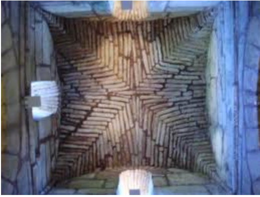
SANTA COMBA DE BANDE, cruceiro.

Bóvedas de cañón en herradura (descargan directamente sobre los muros) en los cuatro brazos de la cruz y bóveda de aristas en el crucero montada sobre arcos de herradura. Bóvedas en ladrillo de tipo espina de pez (técnica romana). Como los templos visigodos no suelen estar abovedados lo anterior singulariza a este edificio.