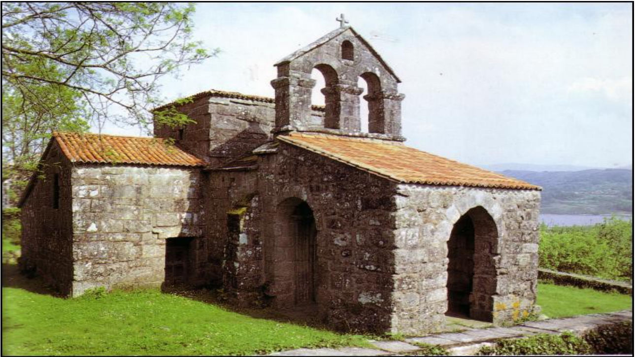
SANTA COMBA DE BANDE.

Prerrománico visigodo, siglo VII. Incorpora algunos elementos asturianos del siglo IX.