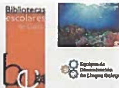
O MAR PROXECTO DE CENTRO 2021-22