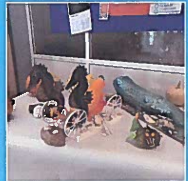
Monstros mariños na literatura