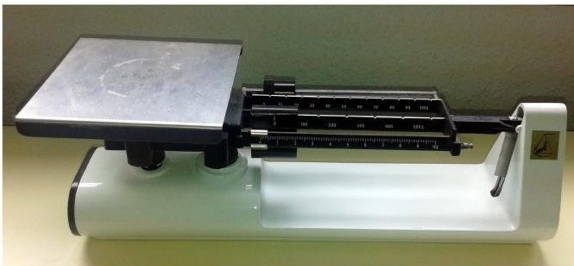
Balanza mecánica de precisión no Laboratorio de Física e Química