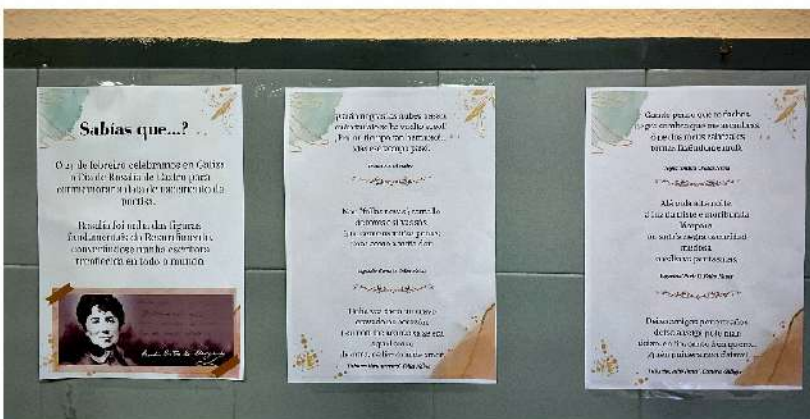
Na cafetería tamén lembran a Rosalía (feito por Paula Riobó)