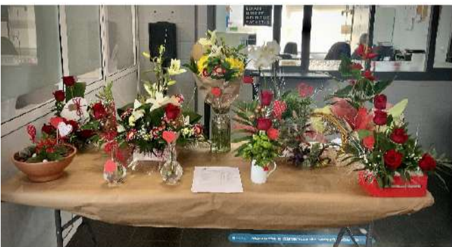
Arranxos florais por San Valentín de FP

“Tú para mí, yo para ti, bien mío —murmurábais los dos— «Es el amor la esencia de la vida, no hay vida sin amor» . Qué tiempo aquel de alegres armonías!... Qué albos rayos de sol!... Qué tibias noches de susurros llenas, qué horas de bendición! qué aroma, qué perfumes, qué belleza en cuanto Dios crió, y cómo entre sonrisas murmurábais: «¡No hay vida sin amor!» (Rosalía de Castro)