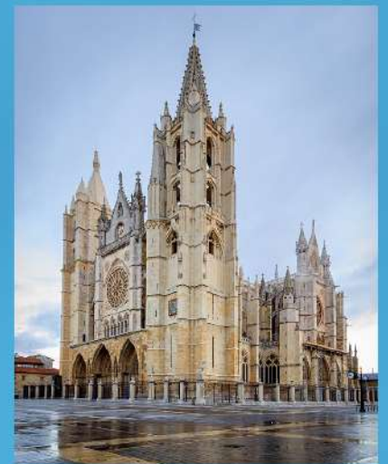
Catedral de León

A máis pura das catedrais de gótico francés en España. A planta segue o modelo da de Reims (Francia) aínda que de menores proporcións. Se avanzamos desde a entrada oeste atopámonos cun plano de tres naves, durante cinco tramos, que se amplía a cinco naves para facer un gran cruceiro, ao que segue unha cabeceira cunha girola á que abren as capelas hexagonais. Como característica hispana, as torres están fóra de planta, o que non ocorre nas catedrais francesas, nin na de Burgos. Nela existe un excepcional conxunto de vidreiras e importantísima variedade de escultura gótica.