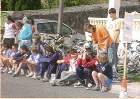
Descansando despois do esforzo.