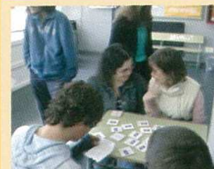
Discutindo a estratexia a seguir