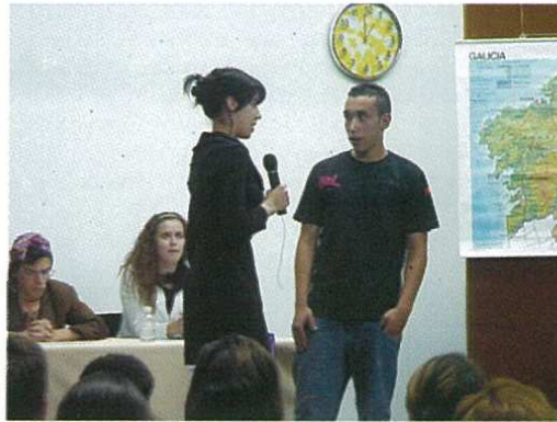
Representación " Un día calquera"

"Foi unha experiencia divertida ,os compañeiros ían engadindo ideas e resultou unha obra improvisada, cada día pensabamos nunha cousa nova, e cada día ía quedando mellor."