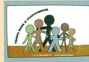
Portada da revista