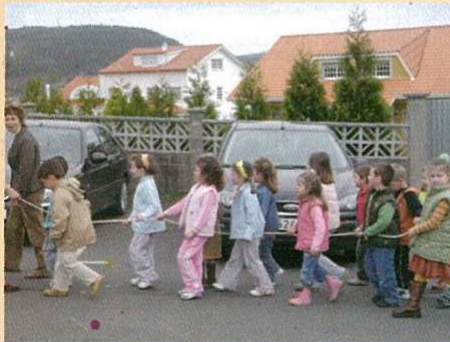
Os alumnos de infantil entrando no instituto.