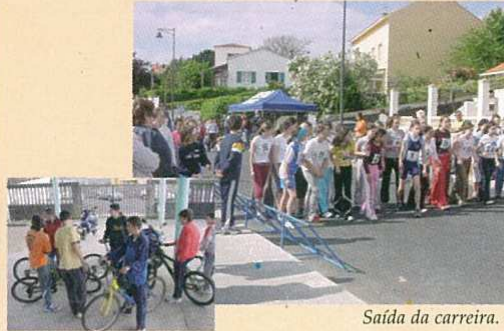
Preparándose no I.E.S. de Mugarbos.