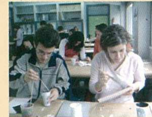
Elaborando o cartel da convivencia