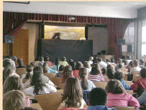
Función de "Pedro e o Lobo".