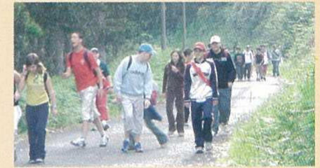
Alumnos percorrendo o camiño.