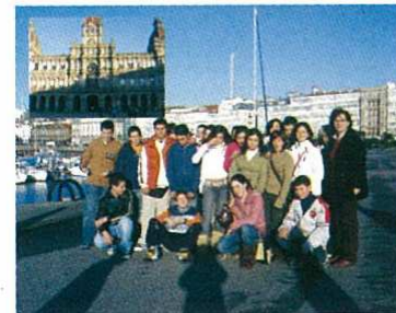
alumnos e titora 2ºB paseo pola Coruña...