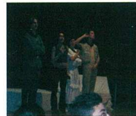
Personaxes da obra respondendo ás nosas preguntas