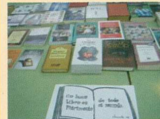
Mostra dos libros