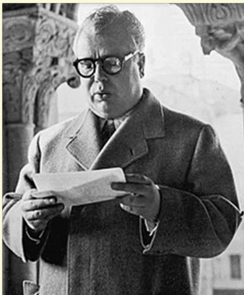
Francisco Fernández del Riego

Francisco Fernández del Riego foi unha figura central da resistencia cultural do galeguismo durante o franquismo e catalizador de moitas iniciativas, institucións e empresas culturais que perseguían a recuperación do galego e a identidade cultural de Galicia naqueles tempo escuros.