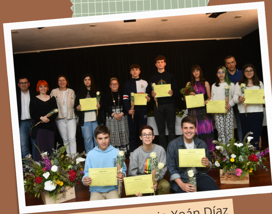
Certame literario Xoán Díaz