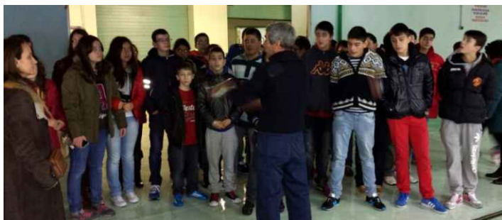
O Alumnado de 1º ESO escoita con atención as explicacións sobre peixes e mariscos que lle dá un empregado do porto da Coruña.