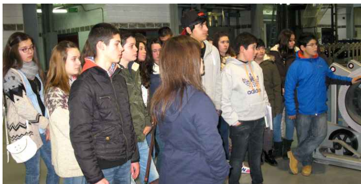
O alumnado de 2º ESO visitou as instalacións do grupo empresarial La Voz de Galicia