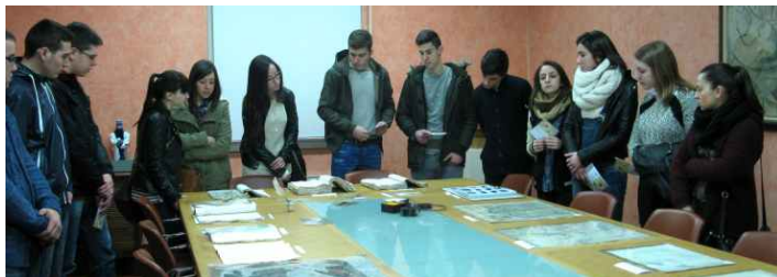
Alumnado de 2º bacharelato no Arquivo do Reino de Galicia