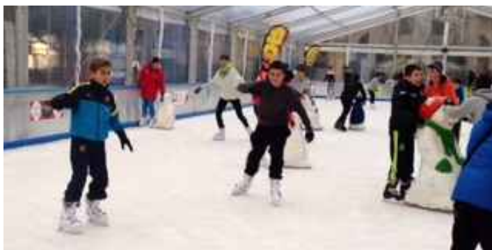
Os alumnos e alumnas de 1º Ciclo da ESO patinamos sobre xeo e, malia as cuadas, divertímonos moito. Ese mesmo día visitamos na Coruña a Casa das Ciencias.