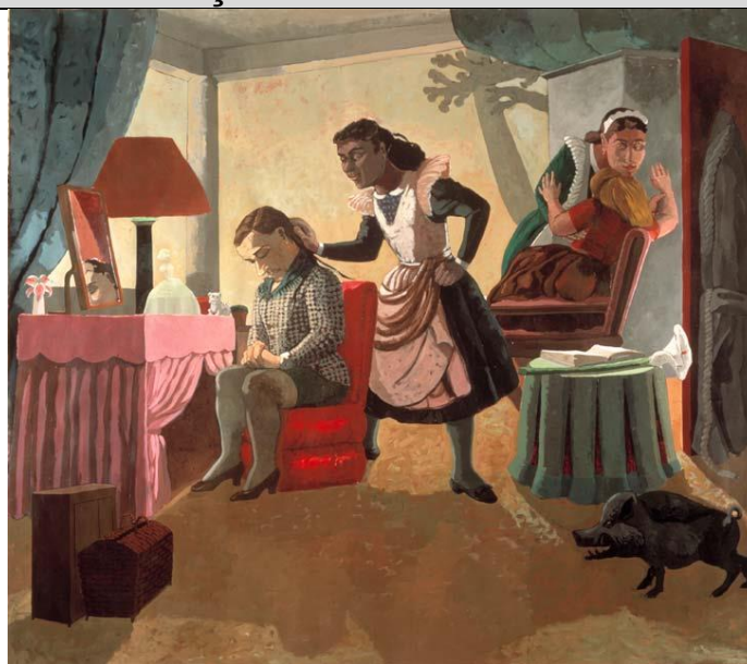
Paula Rego, "As Criadas", 1987.

O que vês no quadro da pintora portuguesa Paula Rego? Em que divisão da casa se passa esta cena?