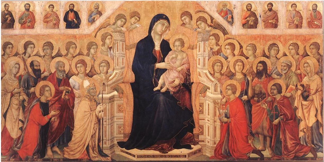
Duccio di Buoninsegna: Maestà

La Maestà, es considerada la obra maestra del pintor italiano Duccio di Buoninsegna .