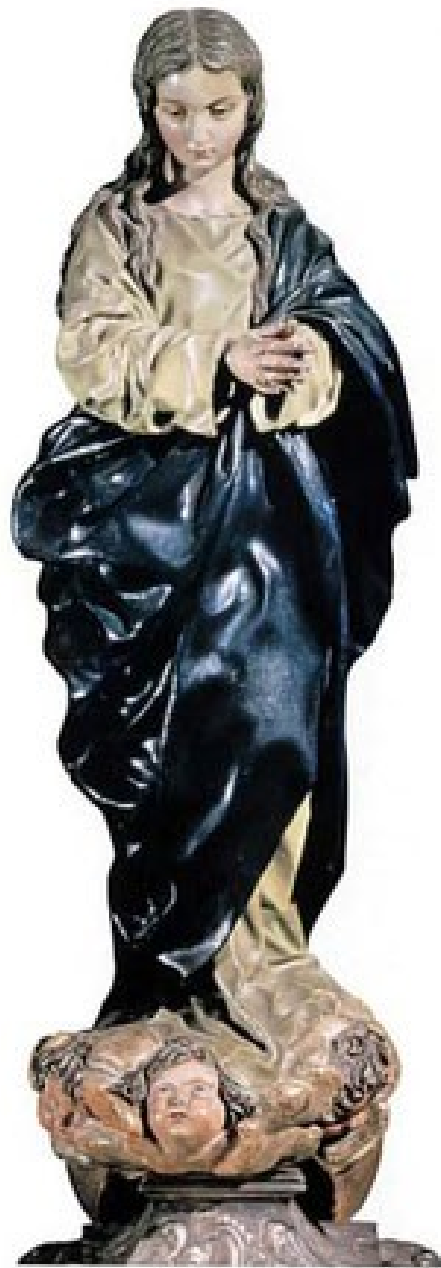
Inmaculada. Alonso Cano.1652.Granada España,

ha jugado un papel singular en la definición del dogma de la Inmaculada Concepción de la Virgen, definido solemnemente por el Papa Pío IX el 8 de Diciembre de 1854 en la Bula " Inefabilis Deus".