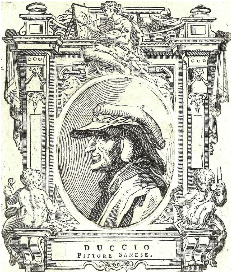
Duccio di Buoninsegna (Siena, actual Italia, h. 1260-id., h. 1318-1319) Pintor italiano.