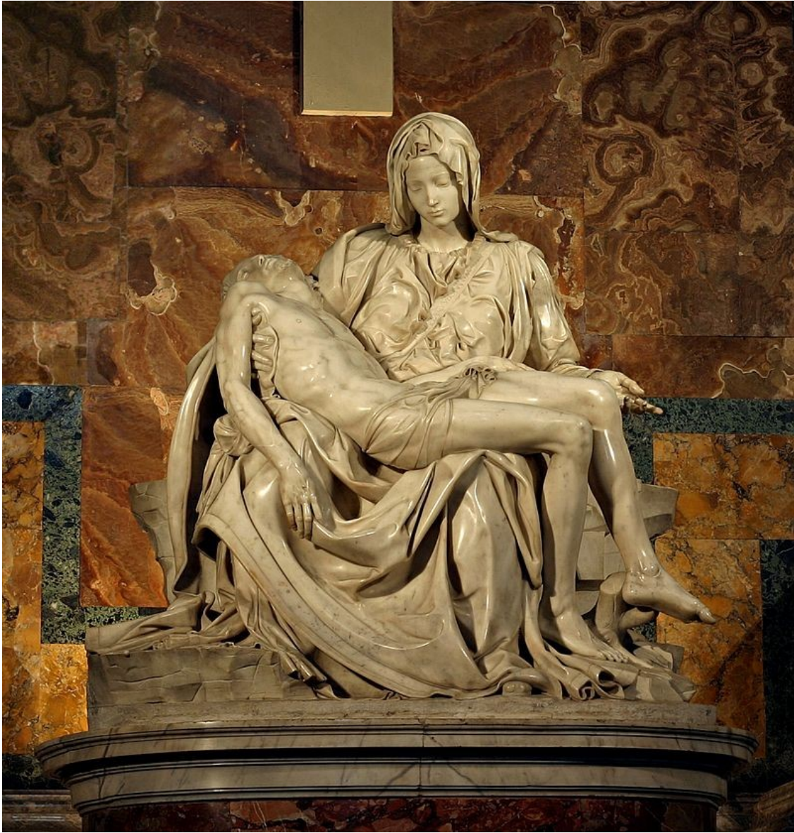
La Piedad del Vaticano o Pietà

es un grupo escultórico en mármol realizado por Miguel Ángel entre 1498 y 1499 . Sus dimensiones son 1,74 por 1,95 m. Se encuentra en la Ciudad del Vaticano .