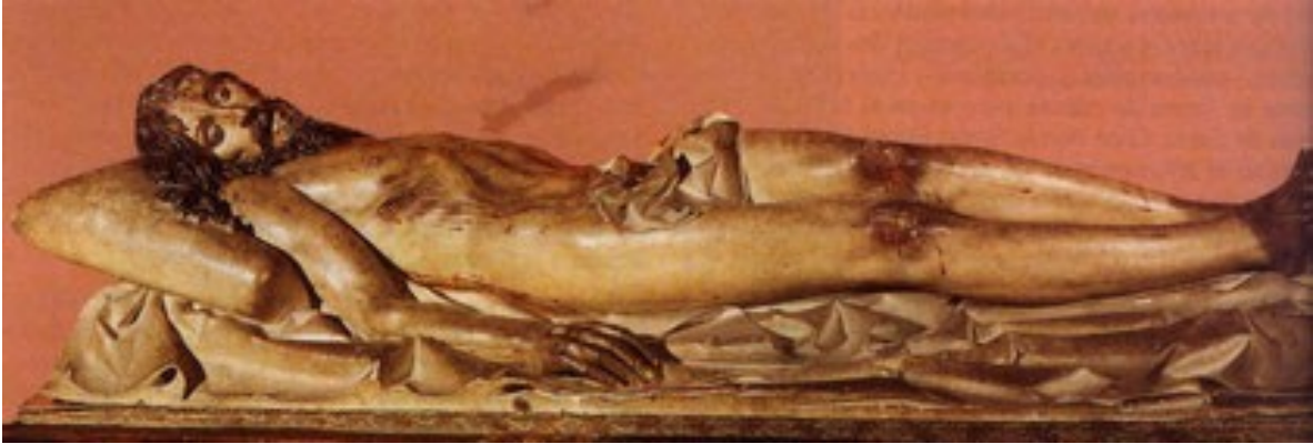
Cristo Yacente. Gregorio Fernández