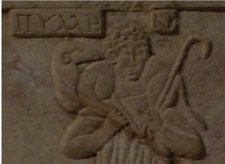
Cristo, el Buen Pastor