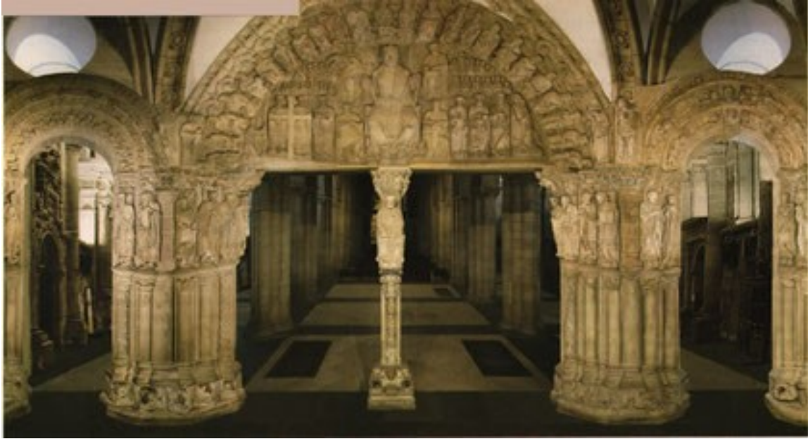
Pórtico de la Gloria. Catedral de Santiago.