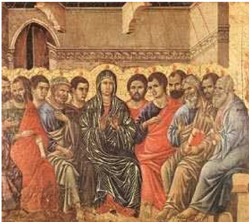
Buoninsegna, María y los apóstoles en el Cenáculo esperando al Espíritu Santo

1.3.2.6. Integración en la comunidad: como mediadora de la presencia por medio de la palabra, de la celebración, de la vida en común y de las expresiones de la fe.