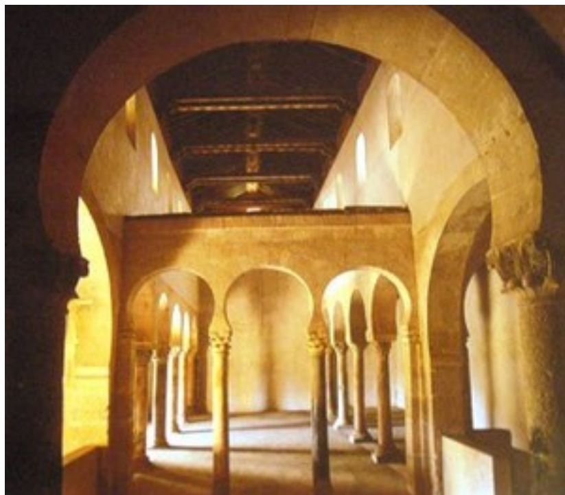
Interior de S. Miguel de Escalada