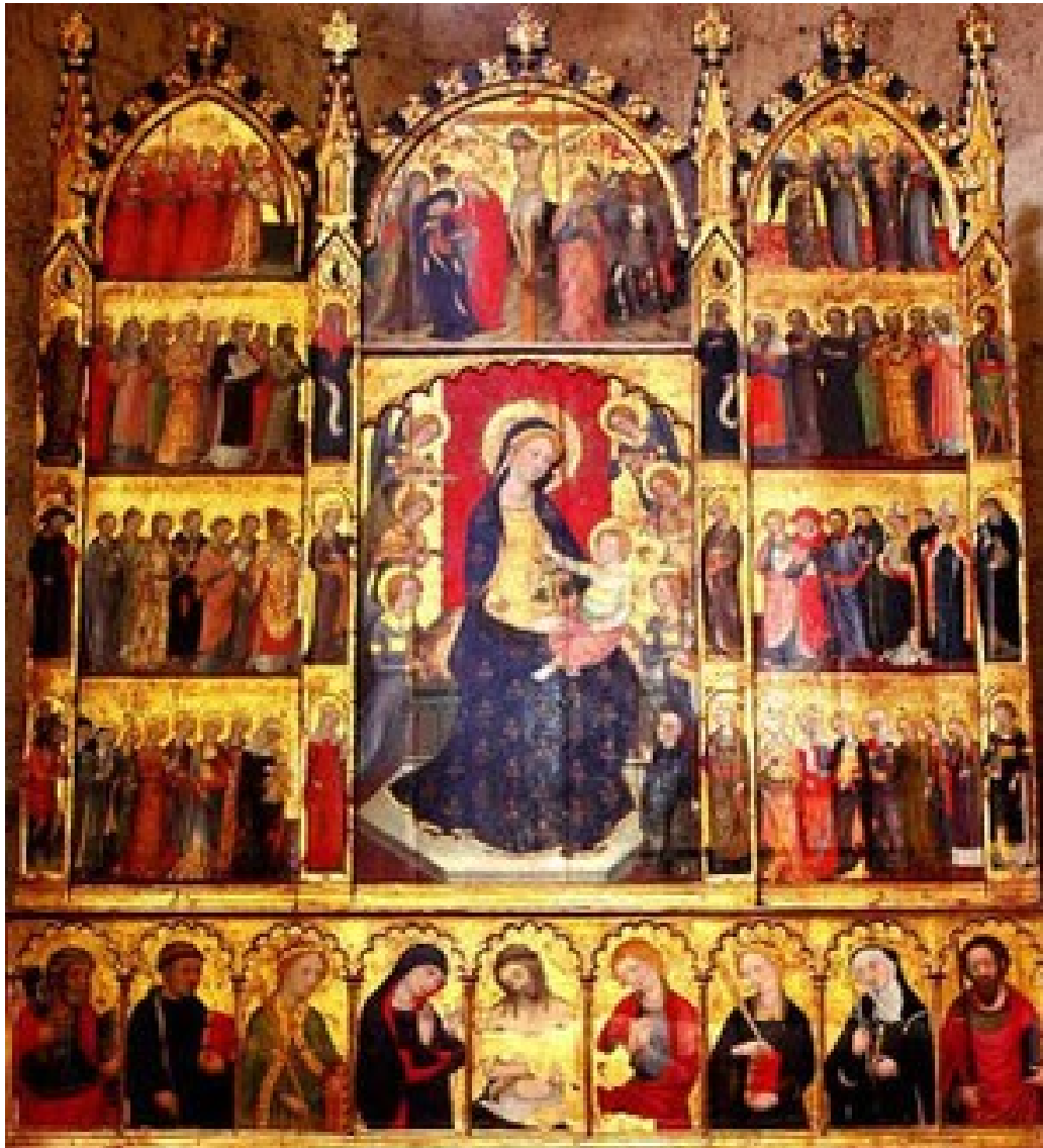
Pere Serra. Retablo de todos los Santos.1375.San Cugat del Vallés