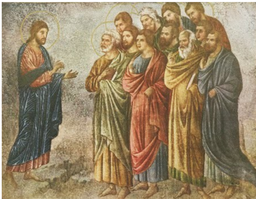
Bouninsegna, Jesús con los Apóstoles. Siena. Museo del Duomo.

“Mientras subía a la montaña fue llamando a los que él quiso, y se fueron con Él. A doce los hizo sus compañeros, para enviarlos a predicar, con poder para expulsar demonios. Así constituyó el grupo de los Doce: Simón, a quien dio el sobrenombre de Pedro, Santiago el de Zebedeo y su hermano Juan, a quienes dio el sobrenombre de Boanerges -los Truenos-, Andrés, Felipe, Bartolomé, Mateo, Tomás, Santiago el Alfeo, Tadeo, Simón el Celotes y Judas Iscariote, que lo entregó”, Mc 3, 13-19.