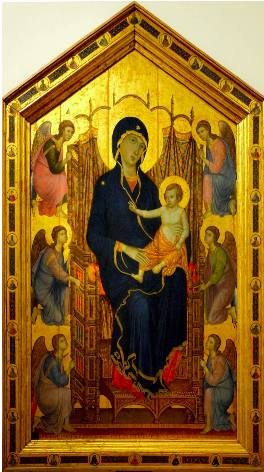
La Virgen de Rucellai