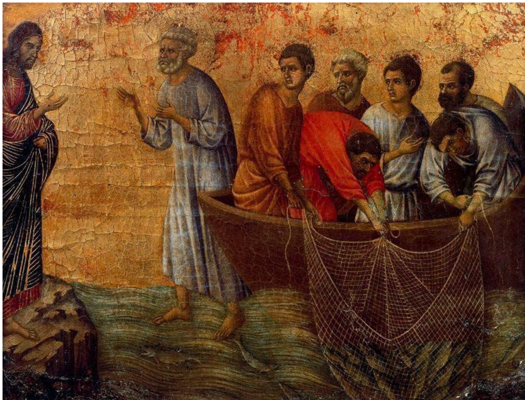
Buoninsegna, La aparición del lago

“Mientras tanto, la barca iba ya muy lejos de tierra, sacudida por las olas, porque el viento era contrario. De madrugada se les acercó Jesús andando sobre el agua, se asustaron y gritaron de miedo, pensando que era un fantasma. Jesús les dijo enseguida; ¡Ánimo, soy yo, no tengáis miedo! Pedro le contestó : Señor, si eres tú, mándame ir hacia ti andando sobre el agua. Él le dijo: Ven. Pedro bajó de la barca y echó a andar sobre el agua acercándose a Jesús; pero, al sentir la fuerza del viento, le entró miedo, empezó a hundirse y gritó: Señor, sálvame. Enseguida Jesús extendió la mano, lo agarró y le dijo: ¡Qué poca fe! ¿Por qué has dudado? En cuanto subieron a la barca, amainó el viento”, Mt 14, 24-32.