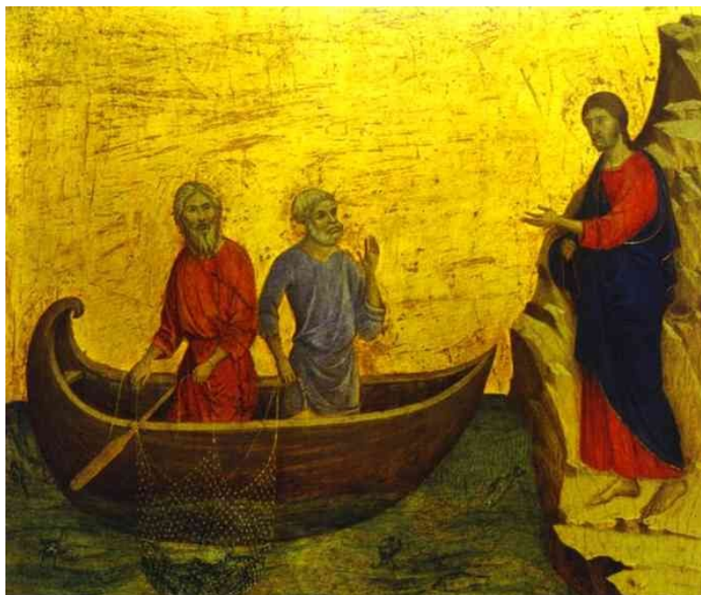
Buoninsegna*, La vocación de Pedro y Andrés.

“Andrés, hermano de Simón Pedro, era uno de los dos que oyeron a Juan y siguieron a Jesús; encuentra primero a su hermano Simón y le dice: Hemos encontrado al Mesías (que significa Cristo). Y lo llevó a Jesús”, Jn 1, 40-42a.