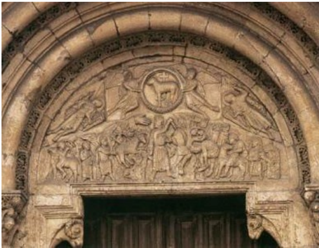
Puerta del Cordero "Agnus Dei". San Isidoro de León.