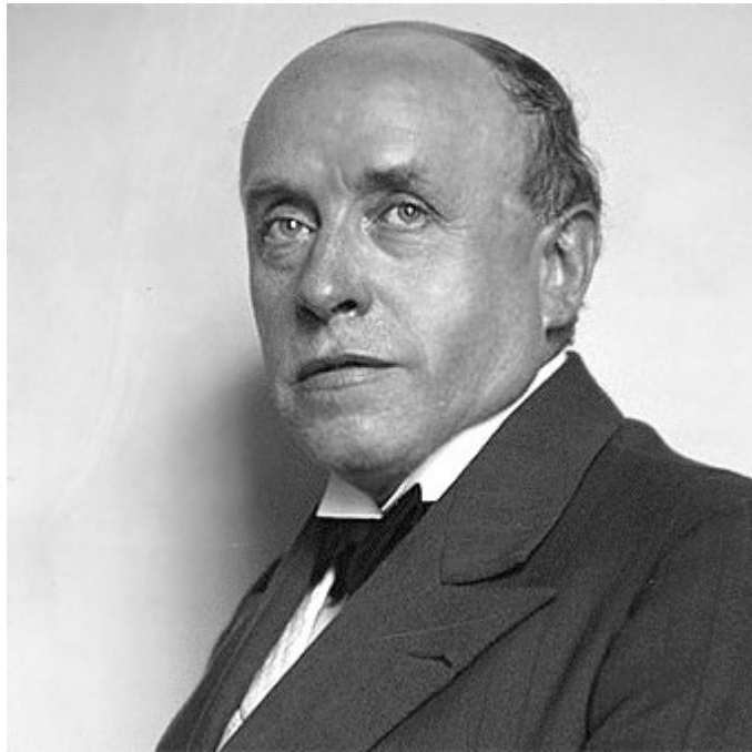
Georges Rouault (París, 1871 – 1958)

Pintor francés dotado de un estilo personal cercano al expresionismo .