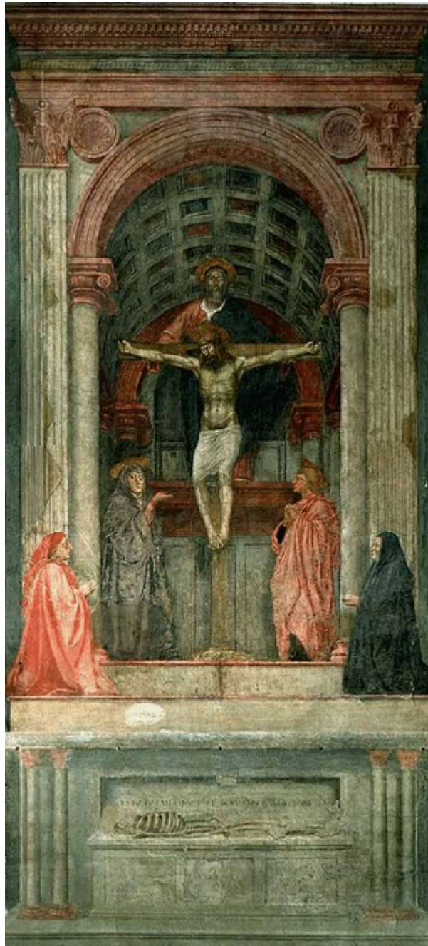
La Trinidad. Masaccio, 1427

Si hay una obra que marca de manera rotunda el triunfo de la perspectiva matemática es La Sagrada Trinidad de Masaccio , uno de los grandes hitos de la pintura europea.