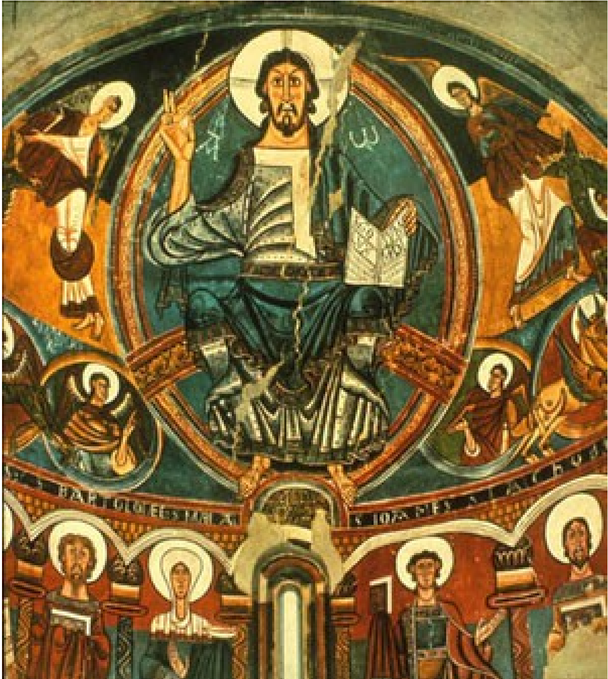
Pantocrátor de San Vicente de Tahull S XII