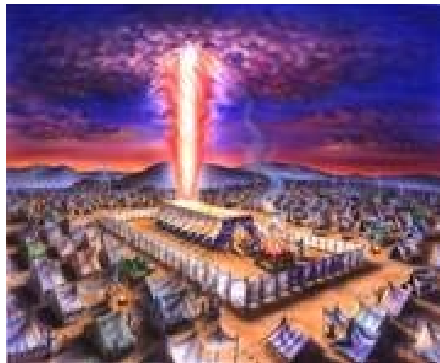
Tabernáculo de David

El tabernáculo se utilizó desde el Éxodo como lugar de reunión y de culto a Jehovah. Desde los tiempos del Éxodo del pueblo judío, el Arca estuvo oculta en el tabernáculo de Hebrón, y fue finalmente llevada al tabernáculo de Jerusalén por el rey David. Según la descripción de la Torá, las murallas de Jericó se derrumbaron al pasar los judíos ante ellas con el Arca. La presencia de Jehovah se hacía visible, mediante la columna de humo que salía del tabernáculo.