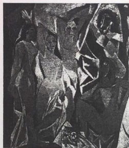
LA COLOMBE POIGNARDÉE ET LE JET D'EAU

Estos son los principales movimientos de vanguardia: