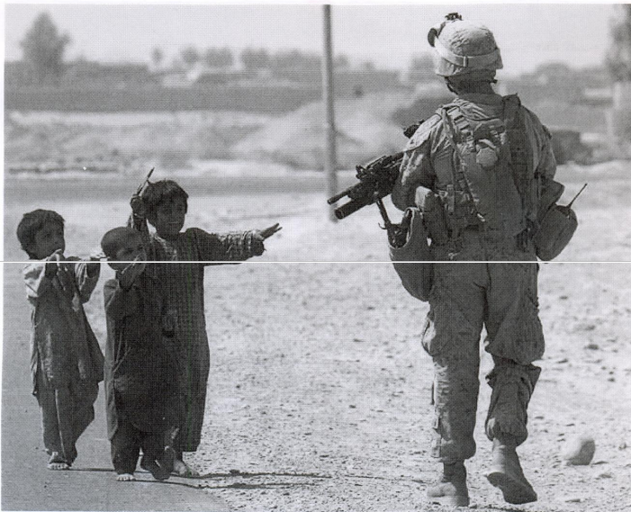
Tres niños afganos se acercan a un soldado estadounidense pidiendo comida.

AFGANISTÁN ES UN MUNDO DE GUERRA, DE PAZ, DE LUZ Y DE OSCURIDAD, DE BIEN Y DE MAL, DE BLANCO Y NEGRO. AFGANISTÁN... ISTÁN , EL PAÍS DE LOS AFGANOS Y LAS AFGANAS, ES UN PAÍS BONITO, PERO... DESTROZADO POR LAS GUERRAS... ES UN PAÍS BÉLICO, ULTRAJADAO Y MENOSPRECIADO.