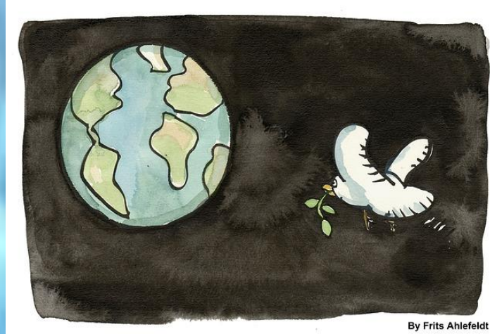
By Frits Ahlefeldt

http://pixabay.com/static/uploads/photo/2013/01/02/17/07/ecological-73334_640.jpg