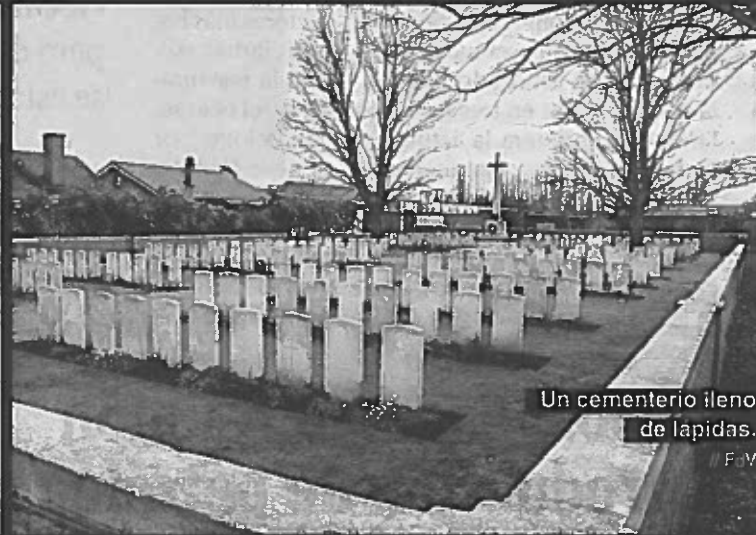
Un cementerio lleno de lapidas.

FARO DE VIGO incluyó incluso una sección de Salud Pública titulada "El curso de la epidemia", en la que informaba puntualmente de la evolución de la enfermedad tanto en Vigo como en el resto de ciudades gallegas. Aquellos relatos de la época muestran, precisamente, cómo las medidas llevadas a cabo durante aquella "gripe española", entre las que se