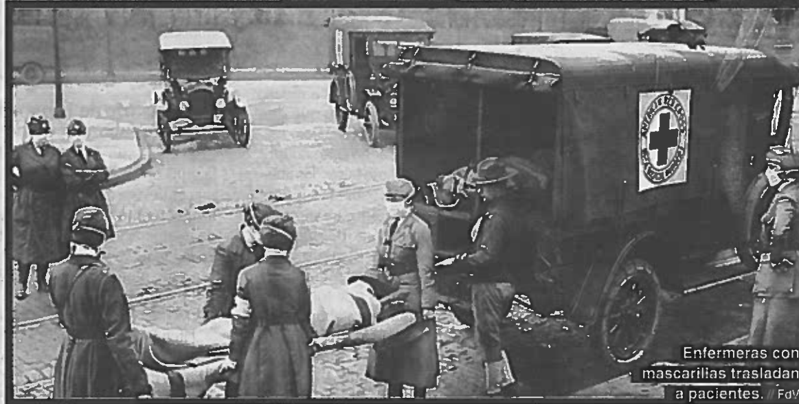
Enfermeras con mascarillas trasladan a pacientes.

encontraba el confinamiento de la población, dieron resultado. En relación a Vigo, se cerró la frontera lusa al tránsito en ferrocarril de personas y mercancías. Más tarde se cerraron los cines y se cancelaron los espectáculos en salones y cafés y se limitó el número de asistentes a las iglesias y a los cementerios.