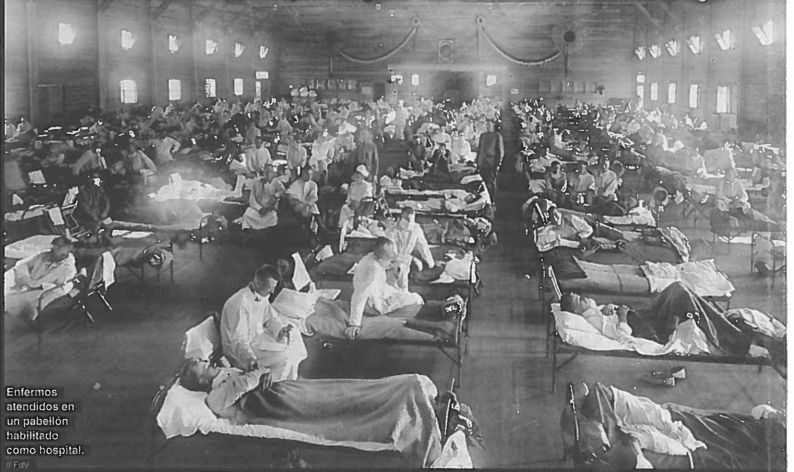
Enfermos atendidos en un pabellón habilitado como hospital.

La actual pandemia de coronavirus guarda ciertas similitudes con la "gripe española" de 1918, considerada la epidemia global más devastadora de los últimos siglos