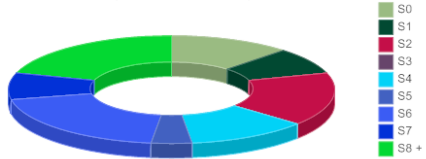
Avaliación 1ª % por número de suspensos