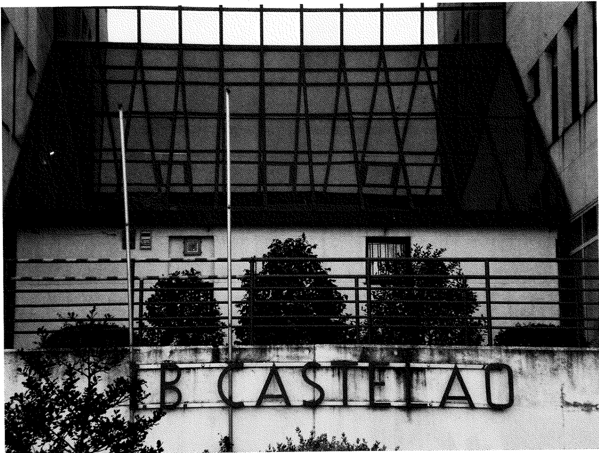
Vigo, febrero 2008