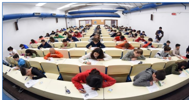
Estudantes realizando a proba na Facultade de Matemáticas en Santiago de Compostela en 2019