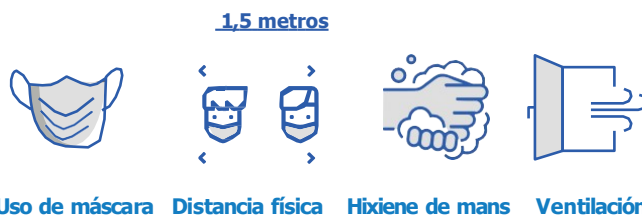
Uso de máscara Distancia física Hixiene de mans Ventilación

Aínda que un contacto estreito teña un resultado negativo no test da Covid-19, é obrigatorio gardar estritamente a corentena ou o período de vixilancia durante o tempo establecido.