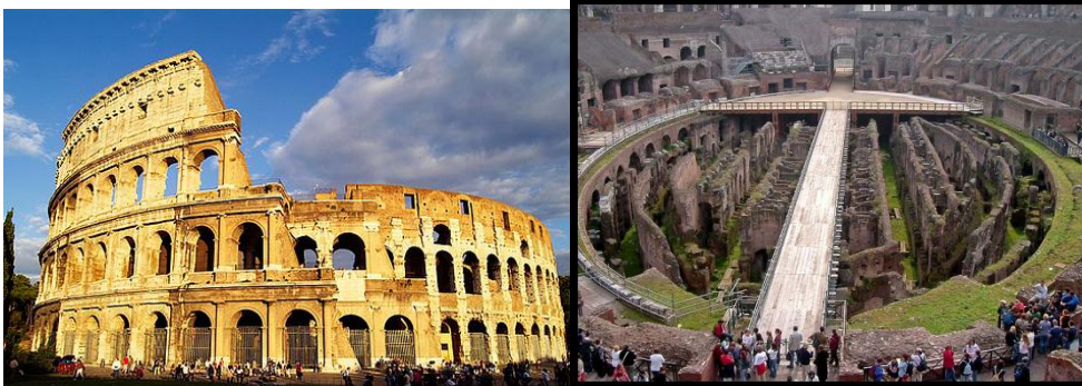
Exterior do Coliseo hoxe

O COLISEO: http://archeoroma.beniculturali.it/siti-archeologici/colosseo