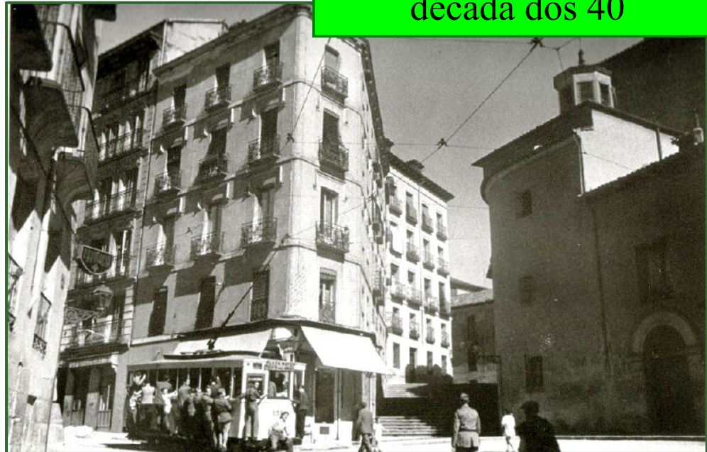
Rúa Segovia, Madrid década dos 40

Ao mesmo tempo, a actividade económica tamén se foi desprazando cara aos ensanches, onde se podía dispoñer de edificios máis amplos e modernos para instalar os negocios. O centro histórico só foi capaz de reter algúns centros administrativos e eclesiásticos instalados en edificios monumentais, así como os comercios tradicionais, pero gran parte do emprego trasladouse a outras zonas.