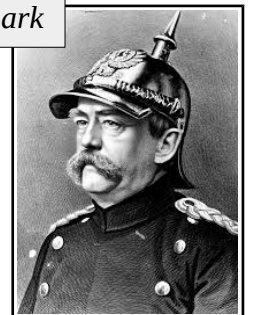
Otto von Bismark

As ideas nacionalistas favoreceron os procesos de unificación de Italia e Alemaña, onde contribuíron á difusión das ideas de construción dun Estado liberal unitario. No último terzo do s.XIX semellaba que Europa acadara unha certa estabilidade política e de fronteiras. Pero unha serie de conflitos seguían latentes .