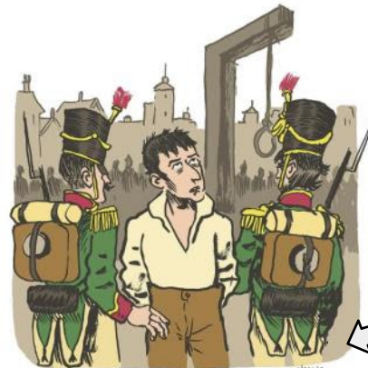
O Xeneral Riego foi o protagonista en 1920 dun pronunciamento contra a monarca absoluto Fernando VII.

A burguesía foi a gran triunfadora e converteuse en conservadora e defensora da orde. Os grupos populares , en cambio, resultaron derrotados ao non conseguir transformacións políticas e sociais máis profundas. Pero tomaron conciencia de clase, e comezaron a organizarse para enfrontarse á burguesía e ao Estado liberal que contribuíran a crear.