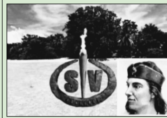
El poeta en la isla, esperando la conexión en directo.

Entró en el concurso totalmente arruinado tras el fracaso de sus últimas coplas; pero la fortuna dio un giro y le permitió hacerse con el premio. Su fortaleza mental, su capacidad de supervivencia y su buena sintonía con el público, gran lector de su obra fueron factores claves.