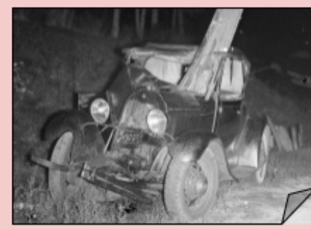
Así quedó el vehículo

Conmocionado, solo preguntaba: "¿Quién ha colocado este poste aquí?"