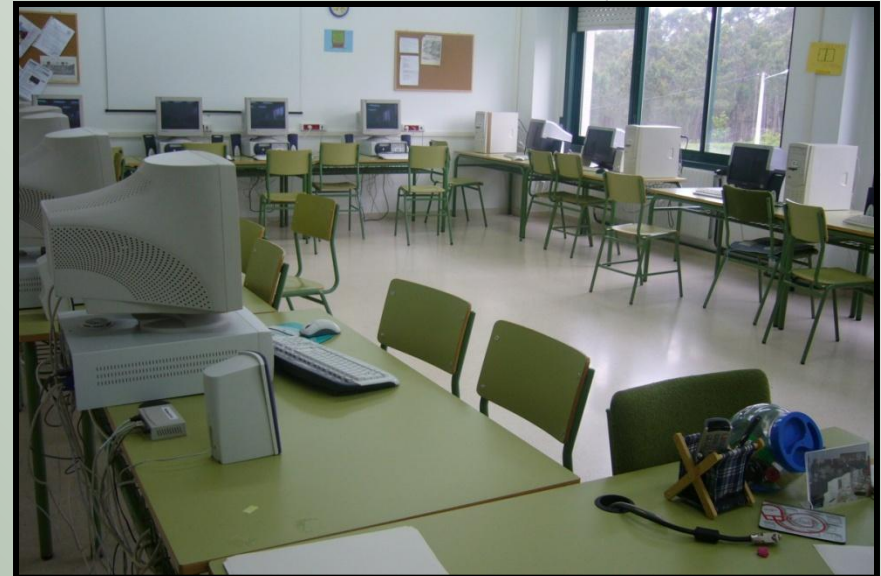
AULA DE INFORMÁTICA