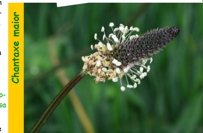
Cast. llantén mayor; Fr. herbe aux blessures; Ing. buckthorn plantain.

Outros nomes: Correola, lingua de ovella, corrá