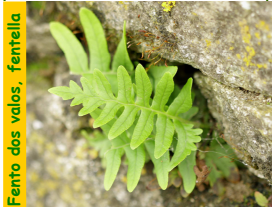
Cast. filipodio; Fr. fern; Ing. fougère

É un fento que vive sobre as paredes e as árbores; ten un rizoma, con abundantes raíces para agarrarse ó substrato no que vive, que está cuberto de numerosas escamas de cor pardo. Do rizoma saen frondes duns 30 cm que teñen ata 26 pinnas; as pinnas a menudo non están totalmente separadas entre sí. Os soros son de cor amarela-verdosa nun comezo, volvéndose ó madurar de cor parda; colócanse en dúas filas paralelas á nervadura, son redondeados e teñen un tamaño de 1-3 mm.