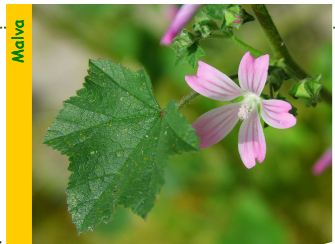
Cast. malva; Franc. mauve; Ing. mallow

Emprégase en forma de cataplasmas para abrandar diviesos e furunchos; son tamén lixeiramente laxantes; as flores administradas como tisana serven para abrandar a tose.