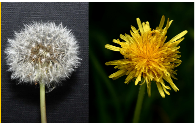
Mexacán, amor de home

Cast: diente de león, amargón; Ing. dandelion; Fr.: pissenlit