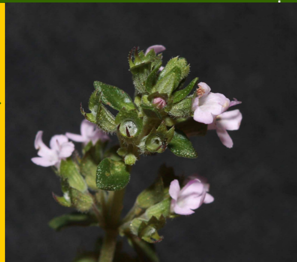
Cast. tomillo, ; Ing. thyme ; Fr.: thym

Mata de pequeno tamaño, perenne, leñosa polo menos na base; as follas son pequenas, duns 6 mm.