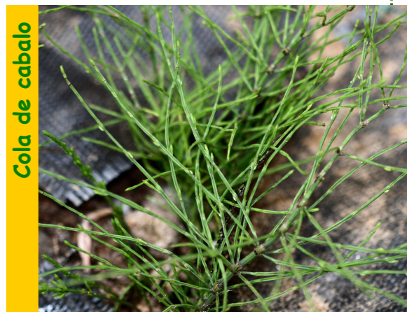
Cast. cola de caballo, cola de rata, junquillo, pinillo; Franc. prêle de douleur; Ing. scouring rushes

Outros nomes: herba canuda, h. estañeira.