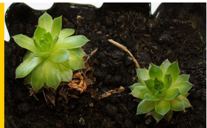
Herba das cortaduras

Cast: siempreviva maior ; Ing. everlasting flower ; Fr.: immortelle, éternelle, jubarbe