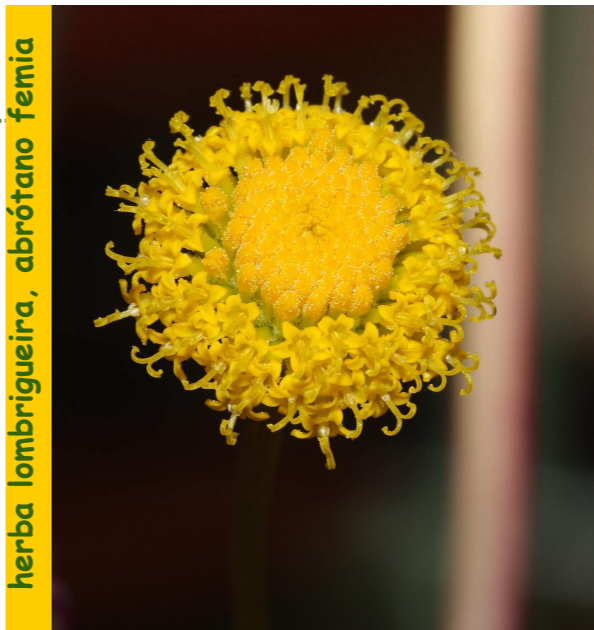
herba lombigueira, abrótnano femia

Cast: abrótnano hembra ; Ing. lavender cotton.; Fr: aurone