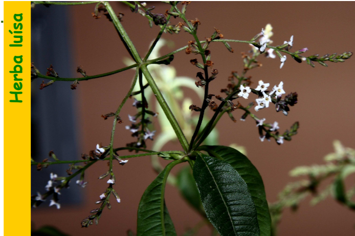
Cast. H. Luisa, verbena de olor, cidrón; Fr. verveine odorante; Ing. Herb louisa, lemon verbam

Ten numerosas utilidades: antiespasmódica, calmante do sistema nervioso, e sobre todo reguladora do aparato dixestivo: contra a inapetencia, os gases, a dor de estómago, os vómitos, etc.