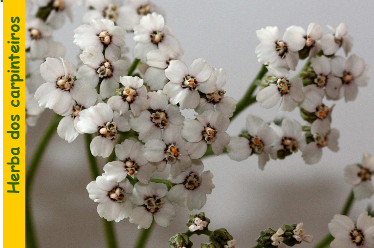
Herba dos carpinteiros

Cast: milenrama, milefolio ; Ing. yarrow ; Fr.: achillée, mille-feuille