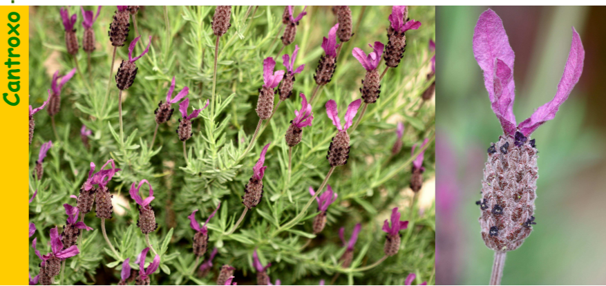
Cast. cantueso; Fr. lavande; Ing. lavender

Con propiedades dixestivas, estimulantes, antiespasmódicas e antirreumáticas; a esencia mesturada con auga serve para lavar feridas xa que é antiséptica.