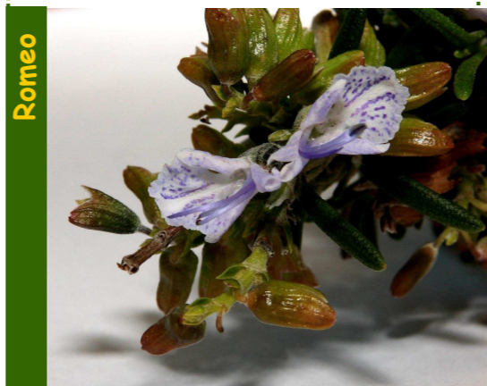
Cast. romero; Fr. romarin; Ing. rosemary

Arbusto de ata 200 cm., de moita rama, recendente; as follas son de cor branca polo envés e teñen forma acicular; toda a planta ten un aroma inconfundible.