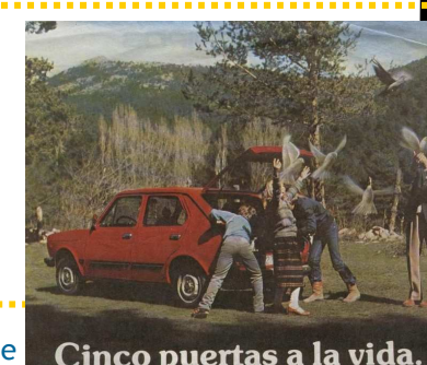
Cinco portas a la vida.

Atopámonos ante a historia sentimental do narrador, desde os primeiros amores infantís ata a iniciación no sexo. Nenas e mozas, veciñas ou de fóra, fillas da cidade ou da emigración... Cada tempo ten un referente feminino e unha palleira pode ser o Templo do Amor.