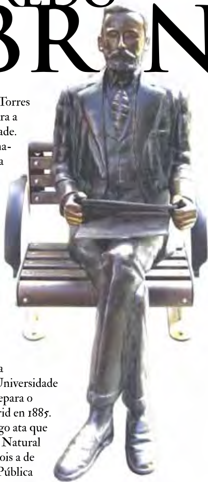
ARRIBA: Estatua de Alfredo Brañas en Carballo. ABAIXO: Registro do bautismo na parroquia de San Xoán de Carballo. SEGUNTE PÁXINA: O Instituto Alfredo Brañas, inaugurado no curso 1970-71.

De volta a Galicia, despois dun brevísimo período traballando nunha notaría en Cambados, matricúlase no Colexio de Avogados de Compostela en 1883 e sería avogado fiscal substituto (1884) ata que pasa a ocupar a Secretaría Xeral da Universidade (1884-1885). Mentres tanto prepara o doutorado, que acada en Madrid en 1885. Comeza a dar clases en Santiago ata que consegue a cátedra de Dereito Natural (1887) en Oviedo e pouco despois a de Economía Política e Facenda Pública (1888) en Santiago, onde permanecerá ata a súa morte, realizando as súas actividades académicas, literarias, periodísticas, políticas e cívicas na defensa de Galicia, resaltando o seu libro El Regionalismo (1889).