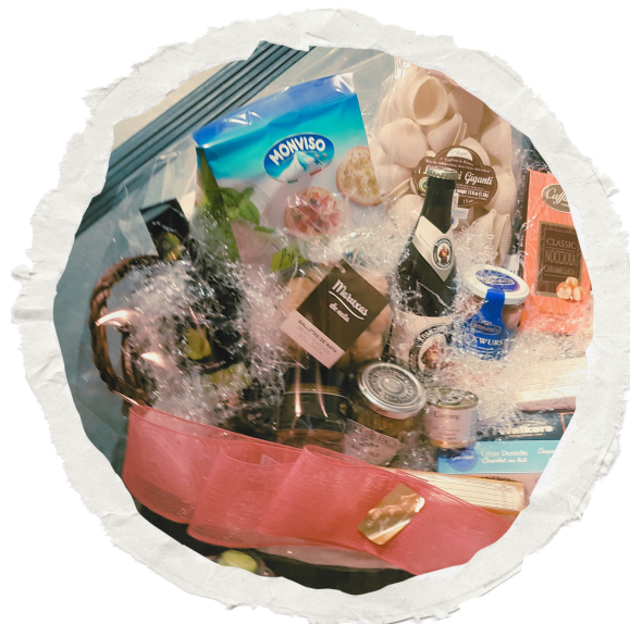
Imaxe da cesta do ano 2020

A cesta sortéase o xoves 21 ás 20.15 , que será o día do Festival de Nadal, e antes das vacacións do período no lectivo.