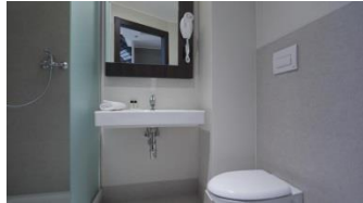
Hotel By B Cenisio 3*