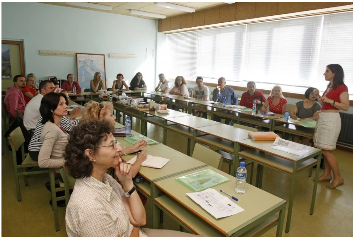
Una clase en la Escuela Oficial de Idiomas durante uno de sus seminarios | Quintana