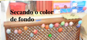
Secando o color de fondo