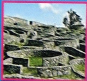
Castro de Santa Tegra