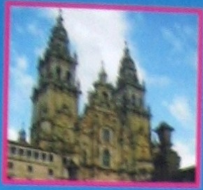
Catedral de Santiago