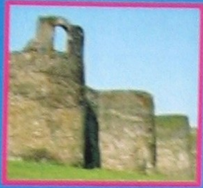
Muralla de Lugo