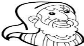
SIMÓN el Cananeo