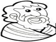
SANTIAGO el Menor