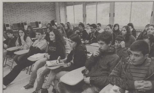
Os alumnos do colexio José García de Mende foron os primeiros en participar na actividade.