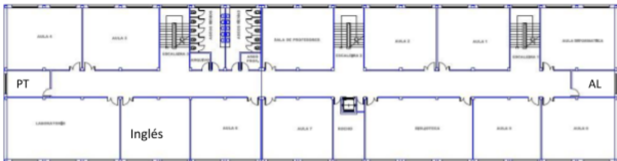
PLANTA PRIMEIRA (PRIMARIA)

Están emprazadas todas as aulas de primaria, e a aula de 6º de infantil, así como aseos para o alumnado e o profesorado. Fronte á escaleira 2 está a Biblioteca, e entre as escaleira 2 e 3 sitúase a Sala de profesores. Nesta planta está a aula de inglés, aula de usos múltiples, aula de PT, aula de AL e o laboratorio de ciencias. Cada curso escolar, en función do número de grupos de cada curso, distribúense as aulas, colocando sempre máis preto das escaleiras da dereita as aulas de 1º, 2º e 3º de primaria, así coma a aula de 6º de infantil. Fronte a sala de profesores sitúanse 5º e 6º de primaria e cara á escaleira de uso preferente do profesorado, 4º.