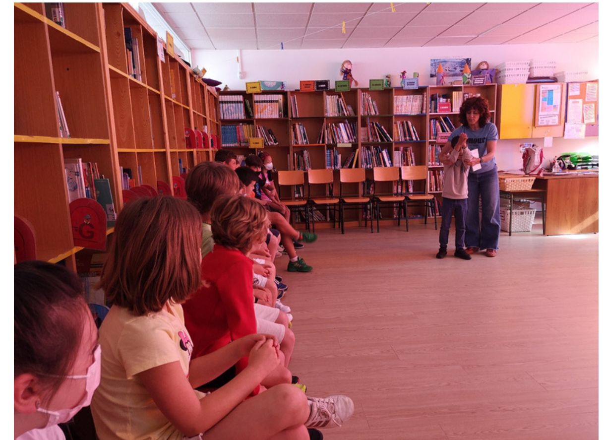
Taller de técnicas para contar un conto