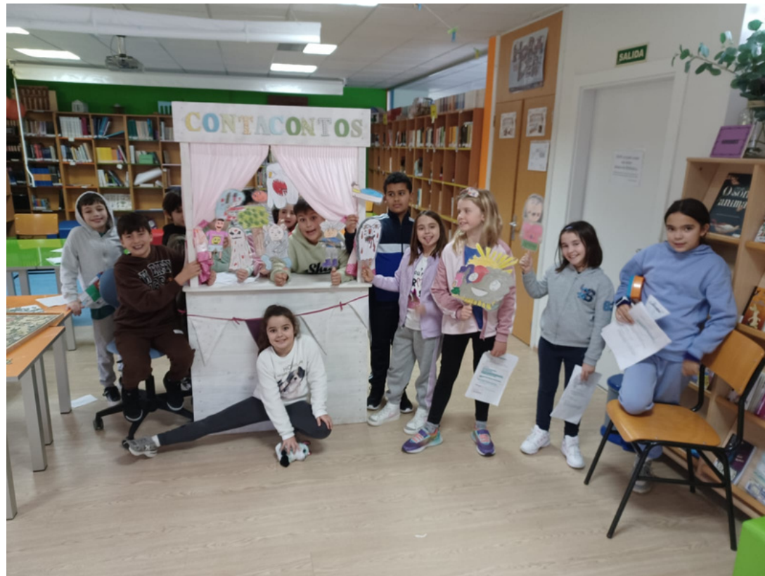
Contacontos Pelos tortos