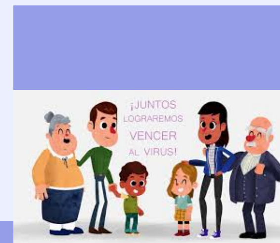
Programa de acollida