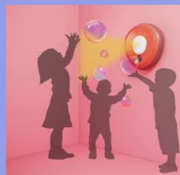
Plan de continxencia