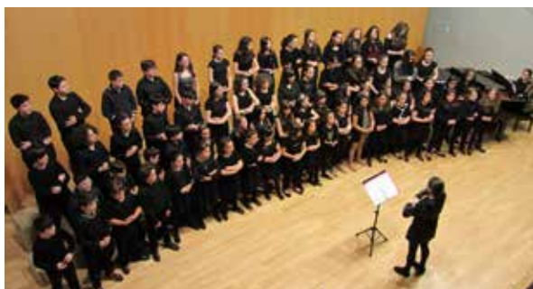
No auditorio do Cmus Xoán Montes de Lugo