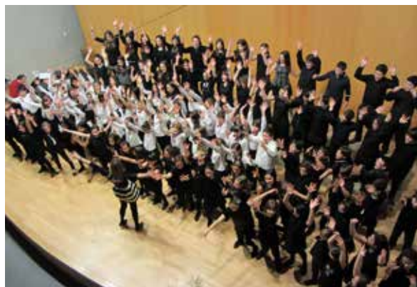
Co coro Infantil do Cmus de Lugo