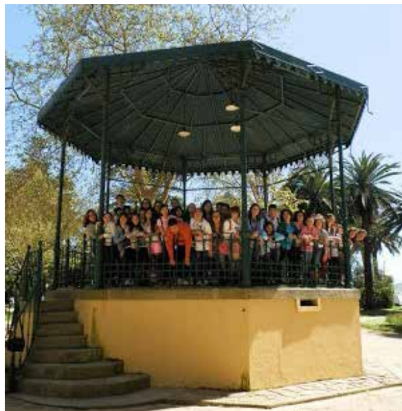
Na viaxe do curso pasado en Porto

Formar parte do Peque Coro é unha experiencia moi divertida e bonita, na que se aprende, pero tamén un pode divertirse. A quen poida, eu recoméndolle vir ao Peque Coro; é de balde e é divertimento asegurado.