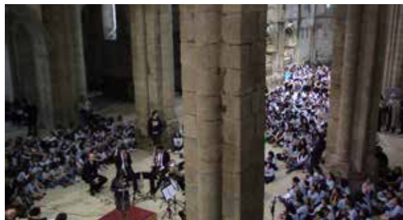
O curso pasado en Bonaval