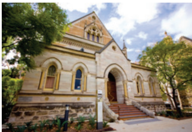
Elder Conservatorium of Music

Algo que me era descoñecido á miña chegada a Adelaide era a ausencia de Conservatorios profesionais. As escolas secundarias tenen a música xa integrada nos seus programas, de tal maneira que