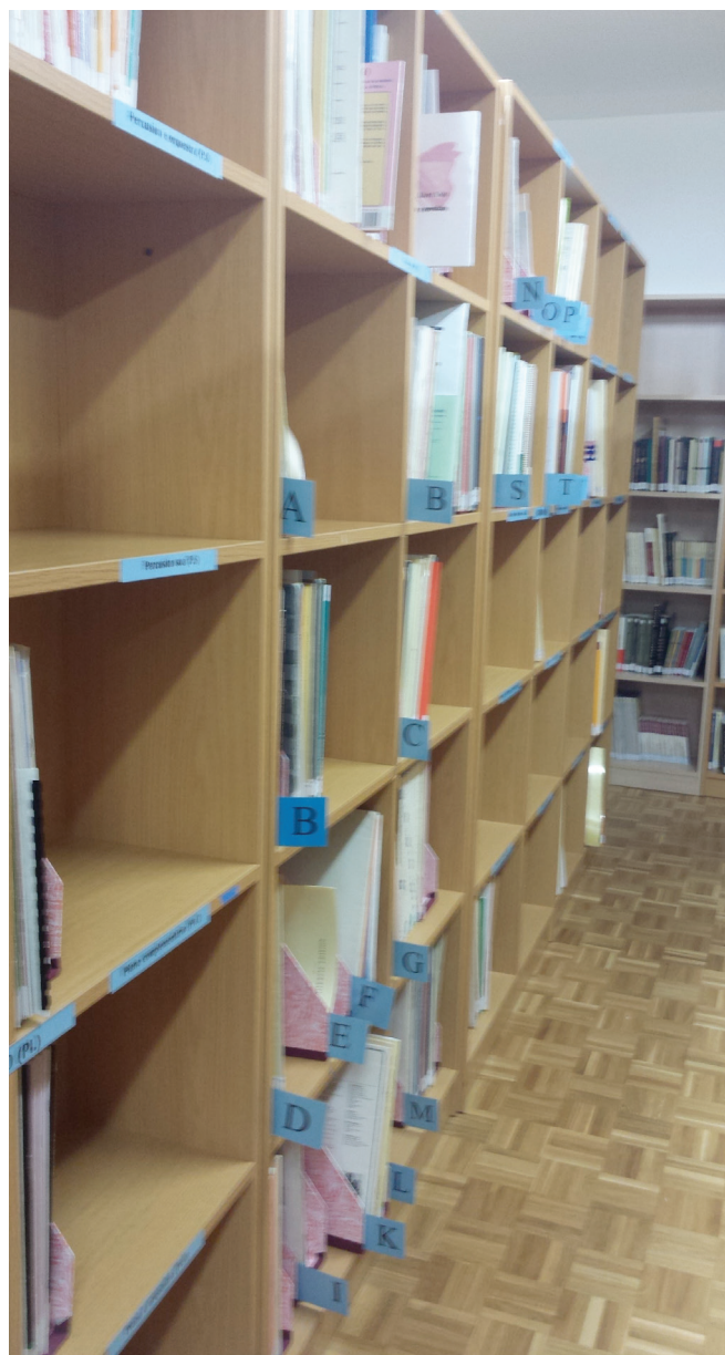
Pasillo de piano

Lembrade que podedes participar no blog comentando as entradas e mesmo consultar todos os fondos da biblioteca na icona "Rede de Bibliotecas de Galicia".