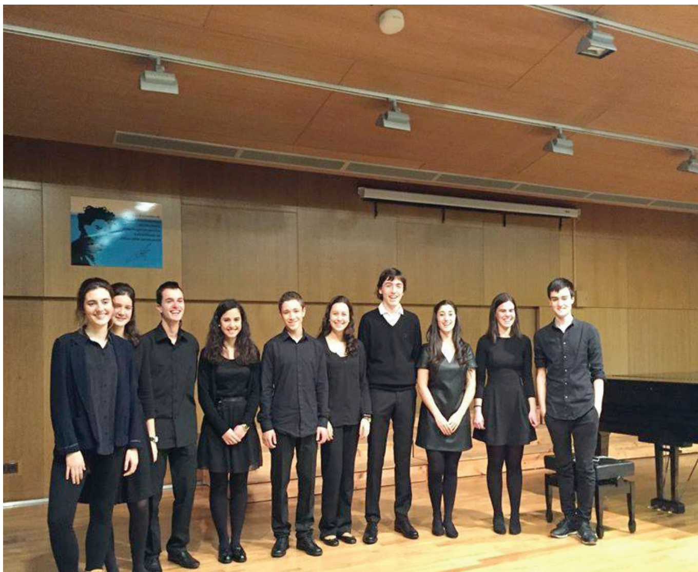
Os participantes da final autonómica

Abrimos as nosas portas o sábado 28 de novembro para escoitar aos finalistas escollidos entre varios conservatorios galegos para seleccionar ao músico que representaría a Galicia na final nacional o 6 de decembro. E certamente, gozamos dunhas actuacións dun nivel excepcional.