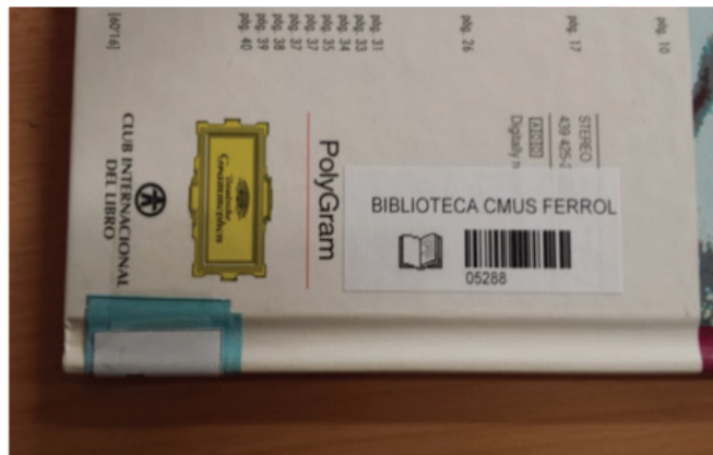
Exemplo de código de barras de un rexistro

- reducir posibles erros ao introducir o número de rexistro manualmente.