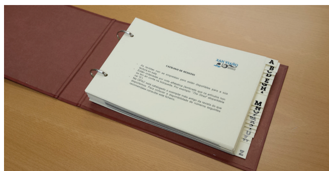
Catálogo de revistas dispoñible na mesa do/a profesor/a encargado/a

En canto ao espazo houbo pequenos cambios tanto na biblioteca física como na virtual (blog):