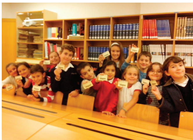
Grupo de 1º D de Linguaxe Musical cos seus novos carnés de usuarios

As visitas teñen como obxectivos: saber localizar os diferentes fondos (audiovisuais, publicacións periódicas, obras para consulta, libros e partituras), interpretar as señalizaciones e signaturas de cada especialidade, coñecer os diferentes servizos da biblioteca e recibir o carné de usuario -con código de barras incorporado-.