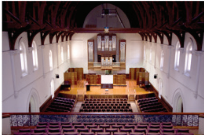
Elder Hall, no que se realizan concertos semanais.

malinterprete, xuzgo o ensaio como vital e o teño en alta estima, pero en verdade ese tempo pode ser incluso máis perxudicial que beneficioso (segundo aprendín, 'practice doesn't make perfect, perfect practice makes perfect'), esto todo a menos que unha vez á semana, non haxa alguén con moito saber elocuencia que poña en palabras aquilo que ti, aínda