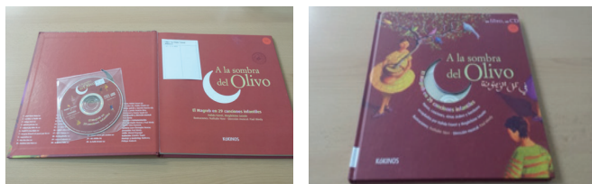
Exemplo de CD anexo e recordatorio da data de devolución do fondo

3. Un código de barras na contraportada do fondo co seu número de rexistro. Seguiremos a poñelo a lápis na garda interior (*R) xunto ca súa signatura.