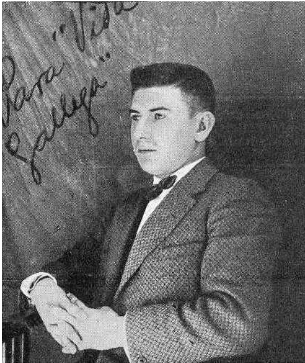
Ricardo Carballo Calero