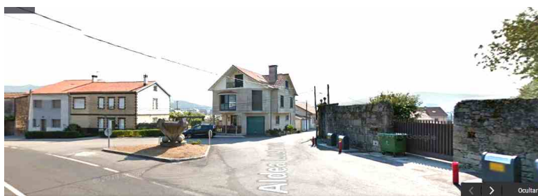
“Rotonda” ao rematar o Hotel Pazo de Lestrobe