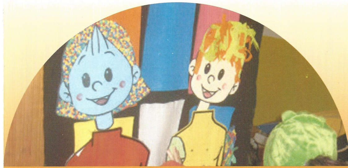
Traballos sobre estereotipos de xénero