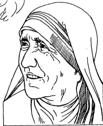
Teresa de Calcuta

Ao rematar, introduce o folleto na urna que está na Biblioteca.