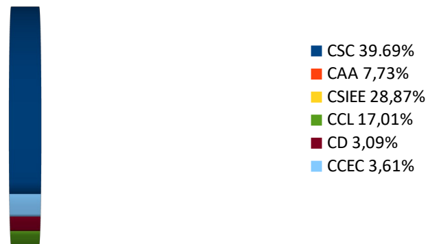
Contribución da materia á adquisición das competencias