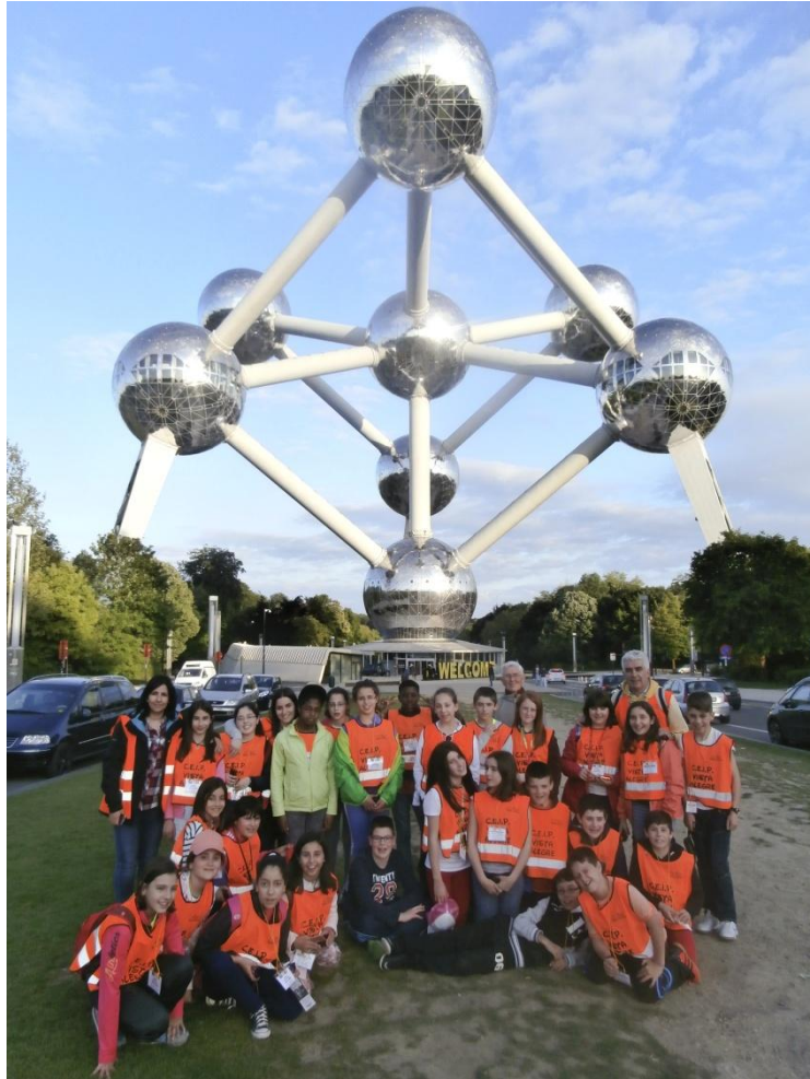
Grupo de alumnos/as de 6º de Educación Primaria del CEIP Plurilingüe Vista Alegre de Burela con sus profesores delante del Atomium en Bruselas. (Mayo de 2015)