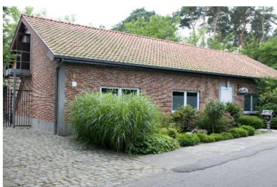
Albergue Vogelsberg en BALEN

Salida del albergue De Vogelsberg a las 6:30 h.