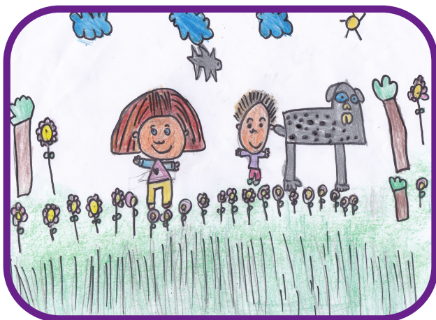
A GALIÑA AZUL Carlos Casares

A aula de 3º B do CEIP Virxe de Covadonga quere, este día, recomendar algúns libros dos que levamos lido este curso; por iso facemos un debuxo e un comentario dalgúnhas das cousas que máis nos gustaron e das ensinanzas destas historias. Esperamos que vos gusten e vos animedes a lelas.