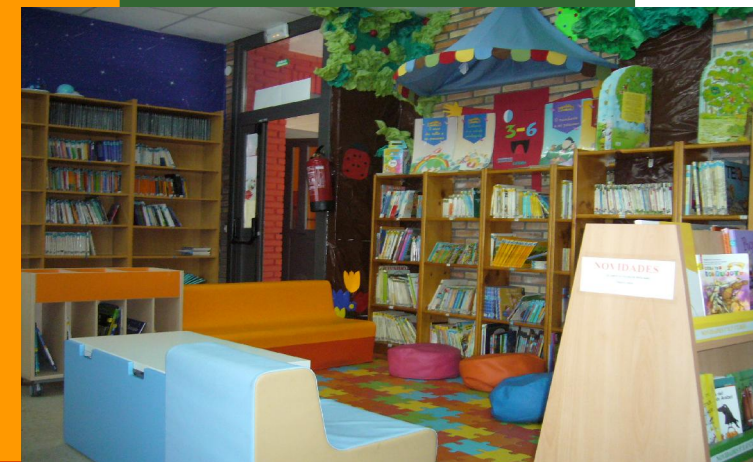
BIBLIOTECA C.EIP TORRE ILLA