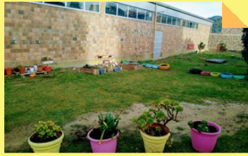
PATIO SENSORIAL E HORTA