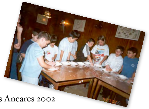
Os Ancares 2002