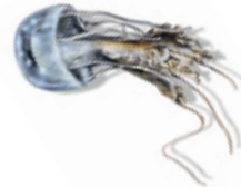
Augamar: caza e devora pequenos animais; pon ovos