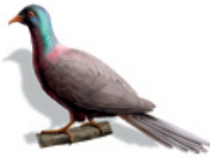
Pomba: come follas, froitos e sementes; pon ovos