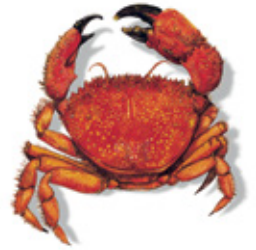
Cangrexo: come algas e animais mortos; pon ovos