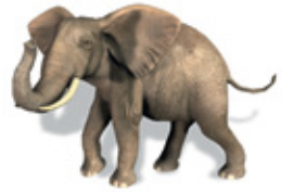
Elefante: aliméntase de plantas; pare as súas crías