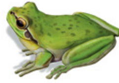
Ra: caza e devora pequenos animais; pon ovos