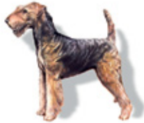
Can: aliméntase de carne e de vexetais; pare os seus cachorros